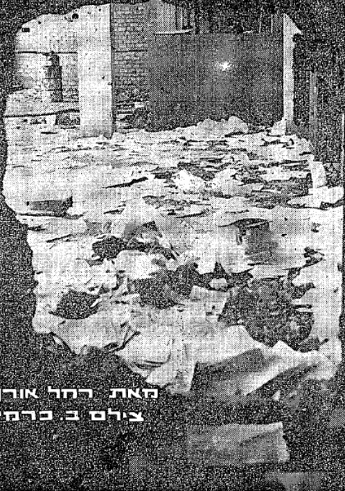
האתר רחל אורן צולם ב-כרמי'

הפגז שפגז מעבר בין אולם הקריאה לבין מחסן הספרים — הניירות נשארזו מאז שנת תש"ח.