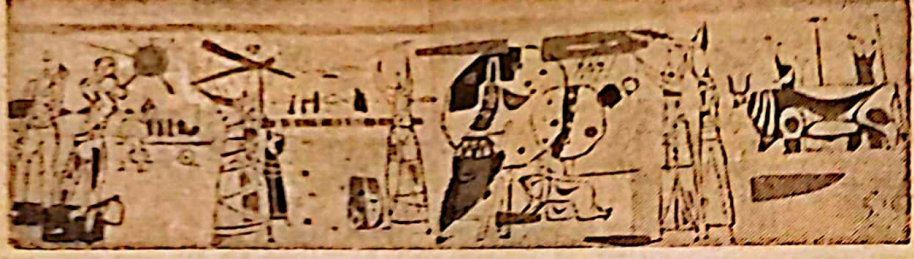
אריה קורן: ארבע תקופות השנה - סקראציו כמית התרבות באשדות יקב

הקוון התימנית נחברת לא רק כי יחוד עולו ובספרות צחוקה, אלא גם כמלאכה אמנות מקורית, שהגיעה לי עתים קרובות לרמה פועלת. היהודים שהיו קוד נחיתה בקרב הישוב הי מוסלמי, החל כמאת השביעית לספר ול, ועשו רובם בעליו מלאכה ואפי עם וערים. כיום האומן האירופי, למד גם האומן התימני מתוך מנעו האיני טימי על התומר, ליצור לא רק עשוי צורף, ארינה, קליעה וקדוה משוב ליים, אלא גם לעטרם ולהעניק להם